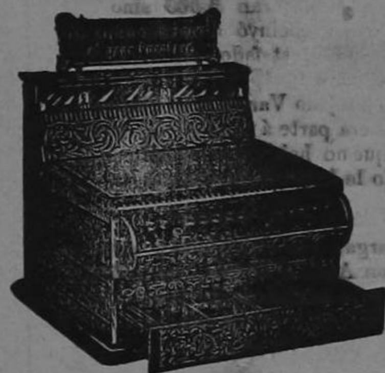
Para pormenores oútrase á MACAYA Y Ca.—UNICOS AGENTES San José de Costa Rica

El aparato es en el exterior de lujoso metal nikelado y al registrar muestra al cliente el importe de su compra, anota el dinero que entra y lo suma automáticamente. La suma es imposible que pueda ser alterada pues queda bajo llave. El Aparato Registrador es una salvaguardia para el empleado honrado. Delata al dependiente infiel é impide toda tentación de sustraerse dinero. La sencillez de su mecanismo evita que se descomponga fácilmente. Todo aparato esta garantizado y su precio relativamente equitativo recomienda su compra.